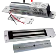
电插锁/磁力锁 (断电开锁类型)