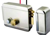
电控锁 (通电开锁类型)